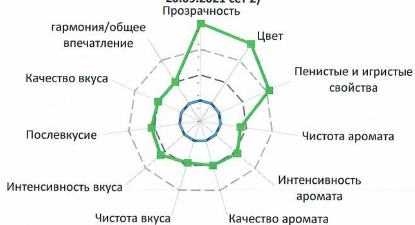
Рис.2.1. Сравнение качества образцов вина игристого (дегустация 20.09.2021 сет 2)