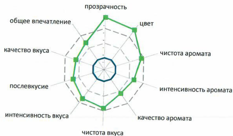
Рис.1.1. Сравнение качества образцов вина тихого (дегустация 14.09.2021 сет 1)