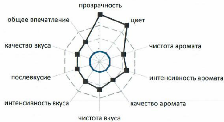
Рис.3.1. Сравнение качества образцов вина тихого (дегустация 21.09.2021 сет 3)