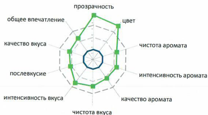
Рис.3.3. Сравнение качества образцов вина тихого (дегустация 07.09.2021 сет 3)