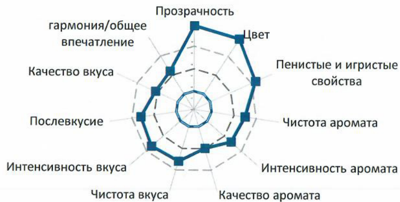
Рис.1.1. Сравнение качества образцов вина игристого (дегустация 20.09.2021 сет 1)