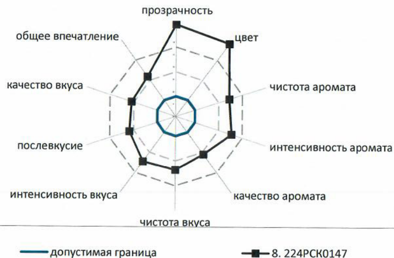
Рис.3.2. Сравнение качества образцов вина тихого (дегустация 10.09.2021 сет 3)

Протокол не может быть воспроизведен полностью или частично без письменного разрешения Руководителя Сенсорной лаборатории.