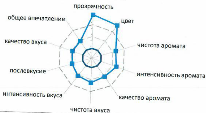
Рис.3.2. Сравнение качества образцов вина тихого (дегустация 17.09.2021 сет 3)