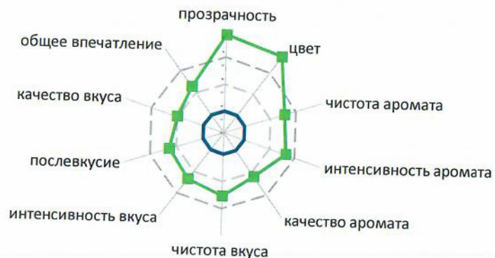
Рис.3.4. Сравнение качества образцов вина тихого (дегустация 17.09.2021 сет 3)