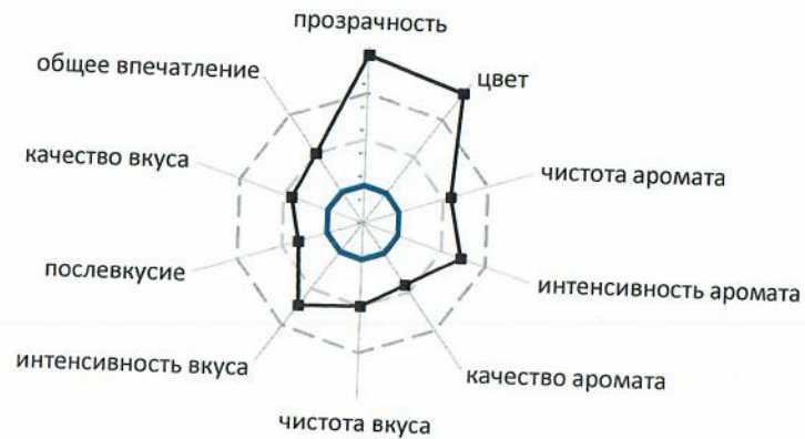
Рис.2.3. Сравнение качества образцов вина тихого (дегустиация 17.09.2021 сет 2)