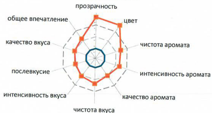
Рис.3.1. Сравнение качества образцов вина тихого (дегустация 13.09.2021 сет 3)