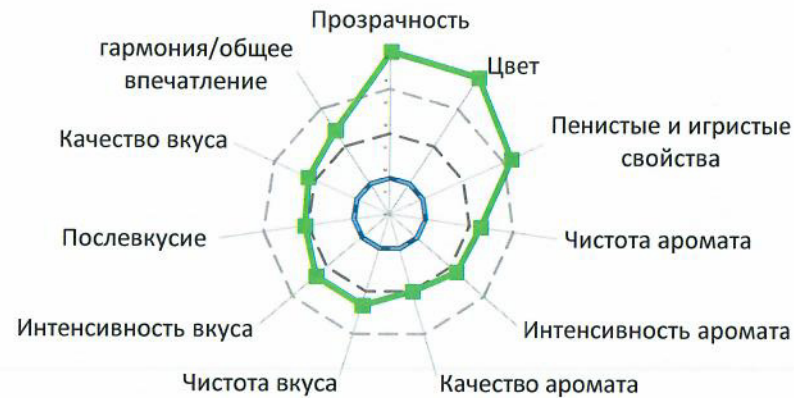
Рис.1.1. Сравнение качества образцов вина игристого (дегустация 22.09.2021 сет 1)