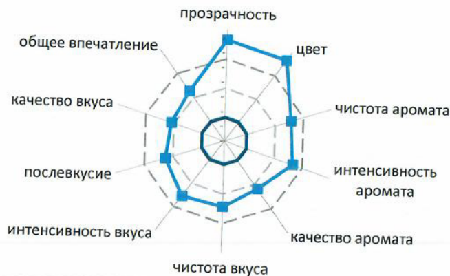
Рис.4.1. Сравнение качества образцов вина тихого (дегустация 13.09.2021 сет 4)

Протокол не может быть воспроизведен полностью или частично без письменного разрешения Руководителя Сенсорной лаборатории.