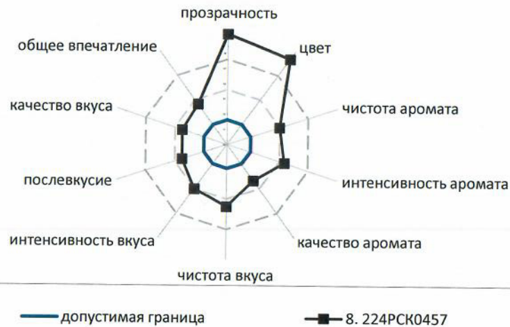
Рис.2.2. Сравнение качества образцов вина тихого (дегустация 21.09.2021 сет 2)

Протокол не может быть воспроизведен полностью или частично без письменного разрешения Руководителя Сенсорной лаборатории.