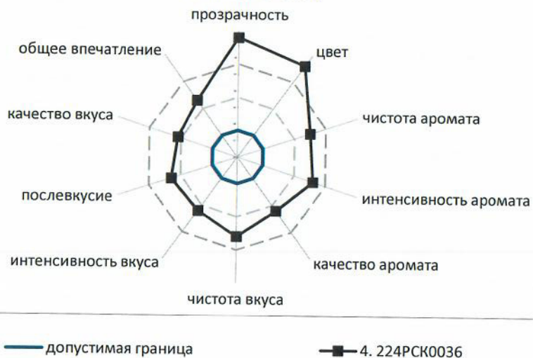
Рис.3.1. Сравнение качества образцов вина тихого (дегустиция 07.09.2021 сет 3)

Протокол не может быть воспроизведен полностью или частично без письменного разрешения Руководителя Сенсорной лаборатории.