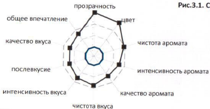
Рис.3.1. Сравнение качества образцов вина тихого (дегустация 18.09.2020 сет 3)