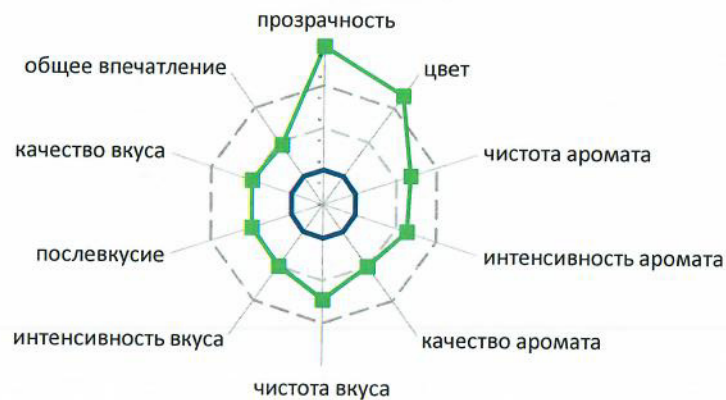
Рис.3.1. Сравнение качества образцов вина тихого (дегустация 21.09.2021 сет 3)