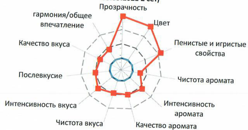
Рис.2.1. Сравнение качества образцов вина игристого (дегустиация 08.09.2021 2 сет) Прозрачность