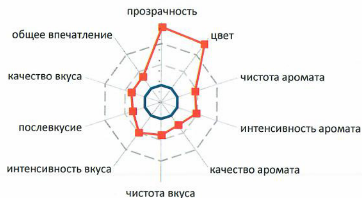
Рис.2.3. Сравнение качества образцов вина тихого (дегустация 21.09.2021 сет 2)