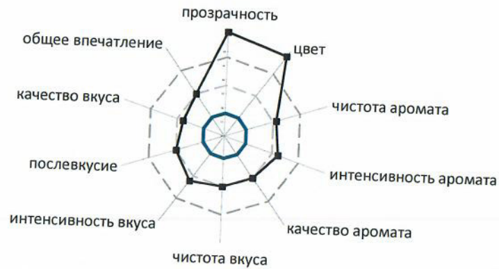
Рис.3.3. Сравнение качества образцов вина тихого (дегустация 08.09.2021 сет 3)

— допустимая граница - - - граница кач-ва —■— 11. 224РСК0073