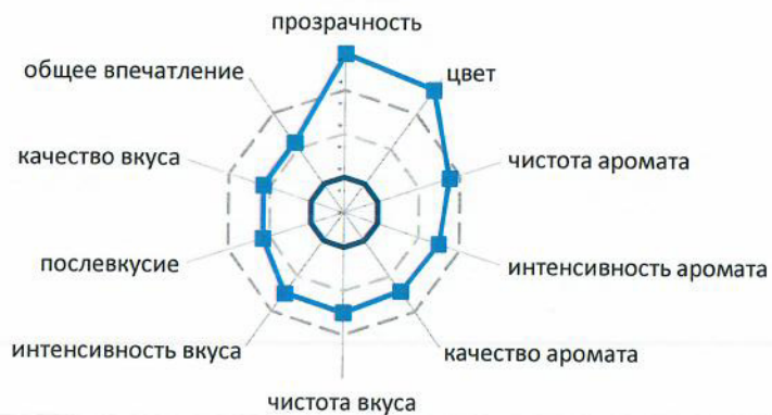
Рис.3.2. Сравнение качества образцов вина тихого (дегустация 21.09.2021 сет 3)