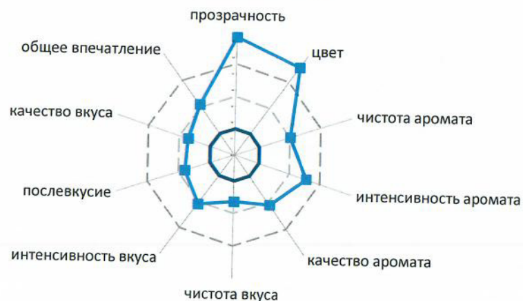
Рис.3.1. Сравнение качества образцов вина тихого (дегустация 07.09.2021 сет 3)