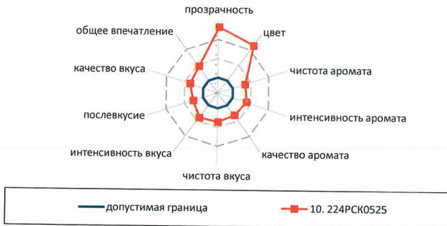
Рис.4.3. Сравнение качества образцов вина тихого (дегустация 23.09.2021 сет 4)

Протокол не может быть воспроизведен полностью или частично без письменного разрешения Руководителя Сенсорной лаборатории. Полученные результаты относятся к предоставленным Заказчиком образцам.