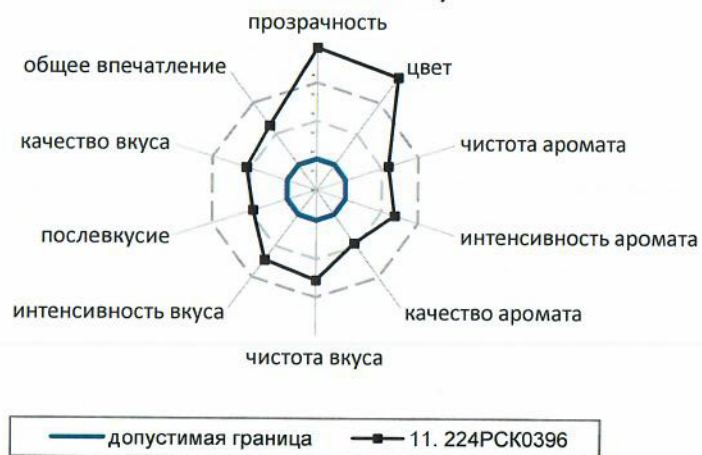
Рис.3.3. Сравнение качества образцов вина тихого (дегустиция 20.09.2021 сет 3)

Протокол не может быть воспроизведен полностью или частично без письменного разрешения Руководителя Сенсорной лаборатории.