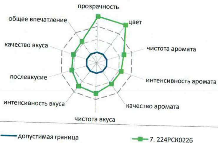
Рис.2.2. Сравнение качества образцов вина тихого (дегустация 14.09.2021 сет 2)

Протокол не может быть воспроизведен полностью или частично без письменного разрешения Руководителя Сенсорной лаборатории. Полученные результаты относятся к предоставленным Заказчиком образцам. Конец выписки из протокола.