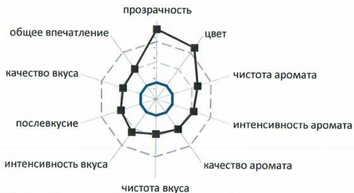
Рис.3.2. Сравнение качества образцов вина тихого (дегустация 23.09.2021 сет 3)