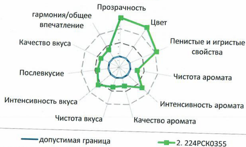
Рис.1.1. Сравнение качества образцов вина игристого (дегустиация 17.09.2021 сет 1)

Протокол не может быть воспроизведен полностью или частично без письменного разрешения Руководителя Сенсорной лаборатории. Полученные результаты относятся к предоставленным Заказчиком образцам.