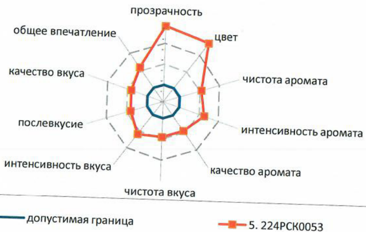
Рис.3.2. Сравнение качества образцов вина тихого (дегустация 08.09.2021 сет 3)

Протокол не может быть воспроизведен полностью или частично без письменного разрешения Руководителя Сенсорной лаборатории. Полученные результаты относятся к предоставленным Заказчиком образцам. Конец выписки из протокола.