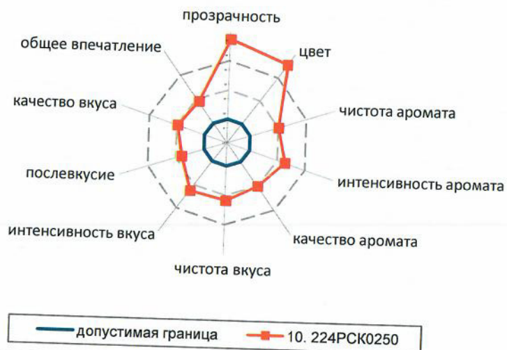
Рис.3.3. Сравнение качества образцов вина тихого (дегустация 14.09.2021 сет 3)

Протокол не может быть воспроизведен полностью или частично без письменного разрешения Руководителя Сенсорной лаборатории. Полученные результаты относятся к предоставленным Заказчиком образцам. Конец выписки из протокола.