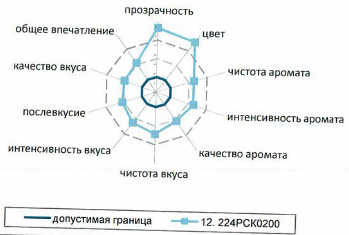
Рис.3.3. Сравнение качества образцов вина тихого (дегустация 13.09.2021 сет 3)

Протокол не может быть воспроизведен полностью или частично без письменного разрешения Руководителя Сенсорной лаборатории. Полученные результаты относятся к предоставленным Заказчиком образцам. Конец выписки из протокола.