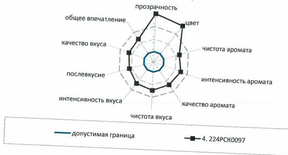
Рис.4.1. Сравнение качества образцов вина тихого (дегустация 09.09.2021 сет 4)

Протокол не может быть воспроизведен полностью или частично без письменного разрешения Руководителя Сенсорной лаборатории. Полученные результаты относятся к предоставленным Заказчиком образцам. Конец выписки из протокола.