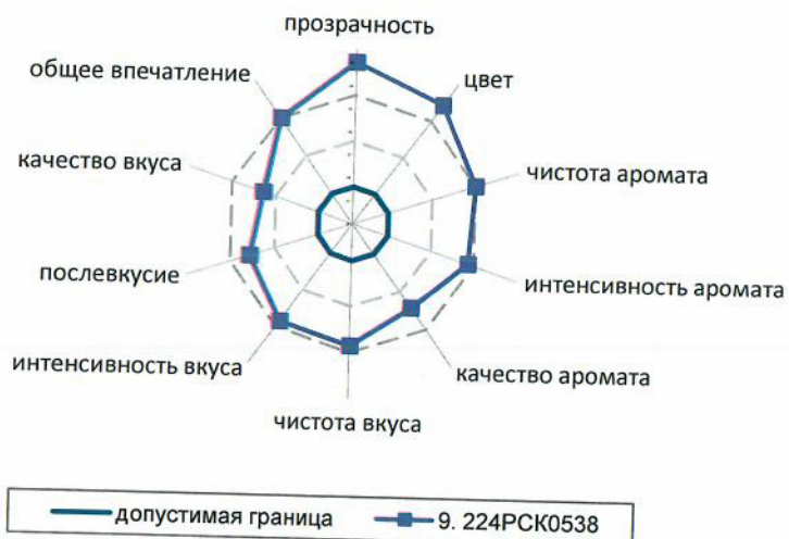
Рис.2.3. Сравнение качества образцов вина тихого (дегустиация 27.09.2021 сет 2)

Протокол не может быть воспроизведен полностью или частично без письменного разрешения Руководителя Сенсорной лаборатории. Полученные результаты относятся к предоставленным Заказчиком образцам. Конец выписки из протокола.