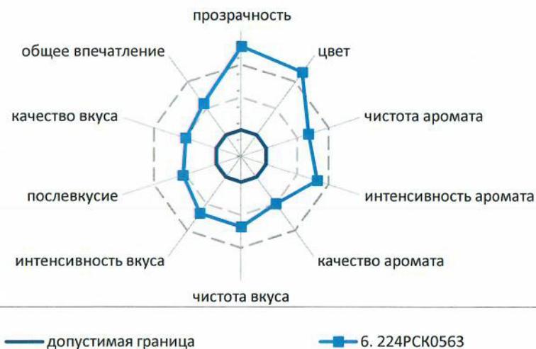
Рис.2.2. Сравнение качества образцов вина тихого (дегустация 24.09.2021 сет 2)

Протокол не может быть воспроизведен полностью или частично без письменного разрешения Руководителя Сенсорной лаборатории.