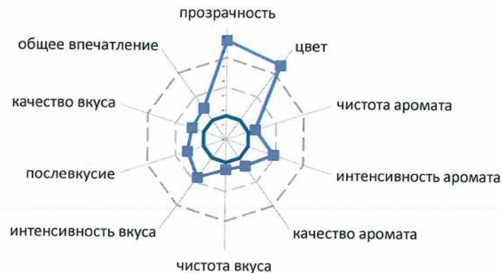
Рис.3.3. Сравнение качества образцов вина тихого (дегустиация 15.09.2021 сет 3)