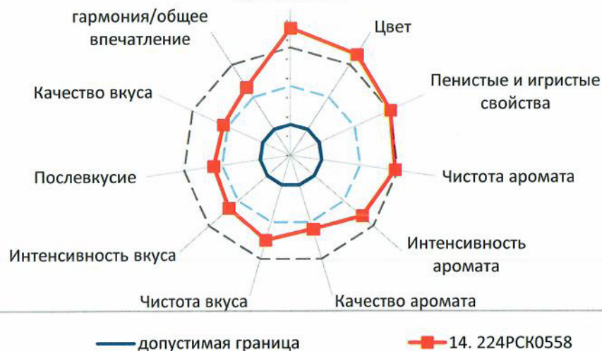
Рис. 1.4. Сравнение качества образцов вина игристого (дегустиация 24.09.2021 1сет) Прозрачность

Протокол не может быть воспроизведен полностью или частично без письменного разрешения Руководителя Сенсорной лаборатории.