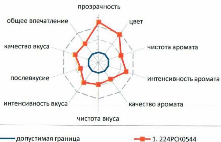
Рис.3.1. Сравнение качества образцов вина тихого (дегустиция 23.09.2021 сет 3)

Протокол не может быть воспроизведен полностью или частично без письменного разрешения Руководителя Сенсорной лаборатории.