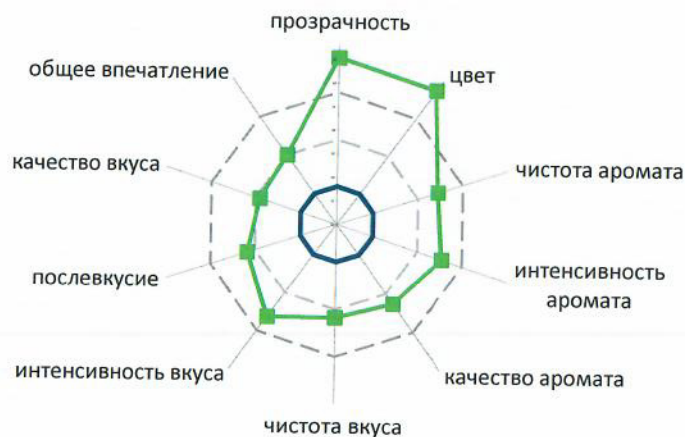
Рис.3.2. Сравнение качества образцов вина тихого (дегустация 07.09.2021 сет 3)