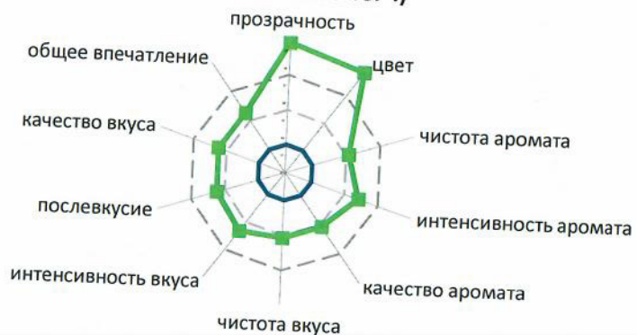
Рис.4.4. Сравнение качества образцов вина тихого (дегустация 09.09.2021 сет 4)