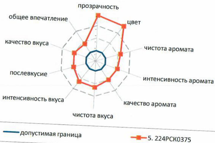
Рис.4.2. Сравнение качества образцов вина тихого (дегустация 17.09.2021 сет 4)

Протокол не может быть воспроизведен полностью или частично без письменного разрешения Руководителя Сенсорной лаборатории. Полученные результаты относятся к предоставленным Заказчиком образцам. Конец выписки из протокола.