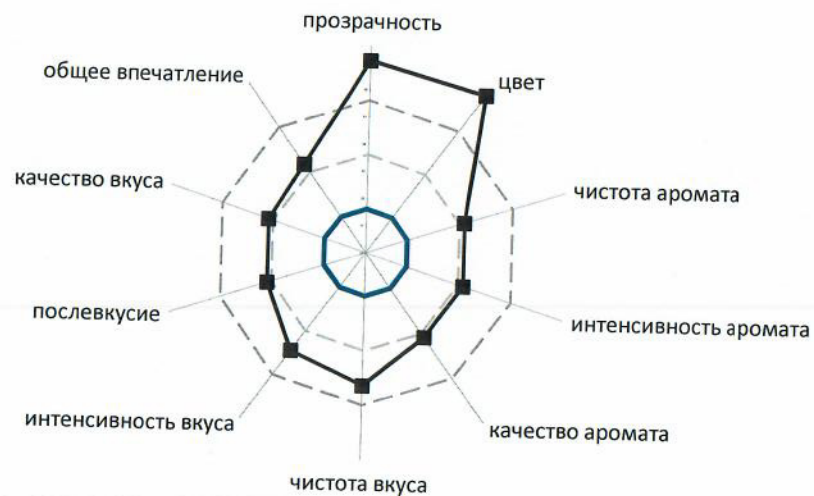
Рис.2.1. Сравнение качества образцов вина тихого (дегустация 14.09.2021 сет 2)

Протокол не может быть воспроизведен полностью или частично без письменного разрешения Руководителя Сенсорной лаборатории. Полученные результаты относятся к предоставленным Заказчиком образцам.