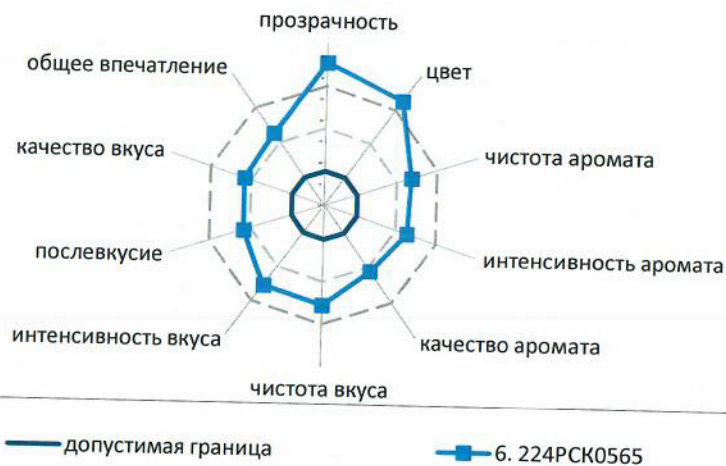
Рис.4.2. Сравнение качества образцов вина тихого (дегустация 24.09.2021 сет 4)

Протокол не может быть воспроизведен полностью или частично без письменного разрешения Руководителя Сенсорной лаборатории. Полученные результаты относятся к предоставленным Заказчиком образцам. Конец выписки из протокола.