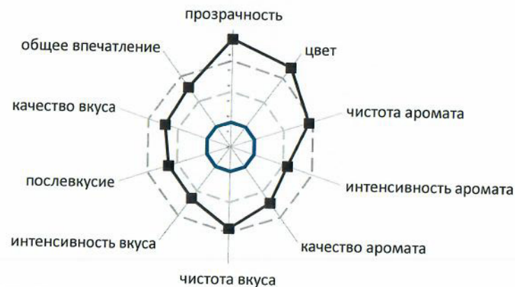
Рис.1.1. Сравнение качества образцов вина тихого (дегустация 27.09.2021 сет 1)