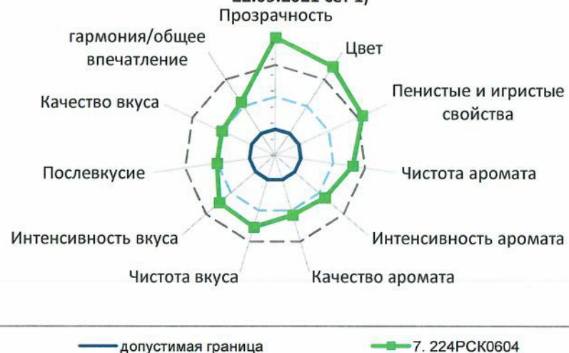
Рис. 1.2. Сравнение качества образцов вина игристого (дегустиация 22.09.2021 сет 1)

Протокол не может быть воспроизведен полностью или частично без письменного разрешения Руководителя Сенсорной лаборатории.