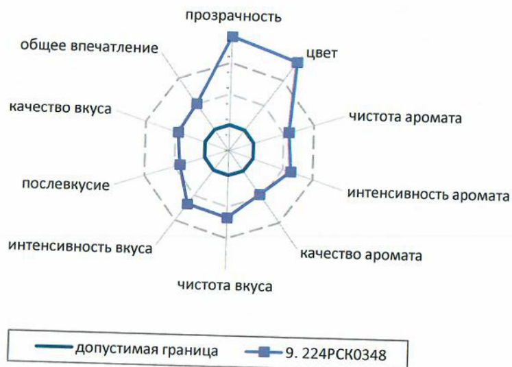
Рис.3.3. Сравнение качества образцов вина тихого (дегустация 17.09.2021 сет 3)

Протокол не может быть воспроизведен полностью или частично без письменного разрешения Руководителя Сенсорной лаборатории. Полученные результаты относятся к предоставленным Заказчиком образцам. Конец выписки из протокола.