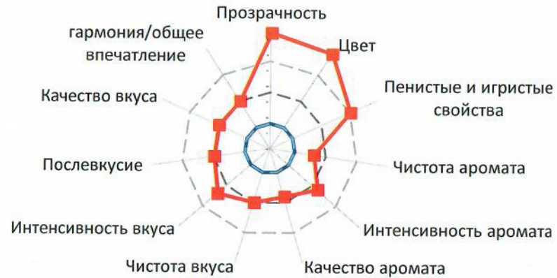
Рис.1.1. Сравнение качества образцов вина игристого (дегустиация 20.09.2021 сет 1)