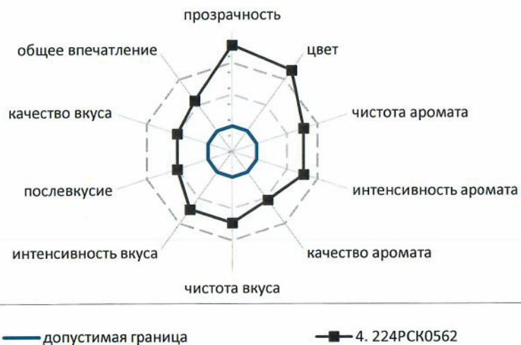
Рис.2.1. Сравнение качества образцов вина тихого (дегустация 24.09.2021 сет 2)

Протокол не может быть воспроизведен полностью или частично без письменного разрешения Руководителя Сенсорной лаборатории. Полученные результаты относятся к предоставленным Заказчиком образцам. Конец выписки из протокола.