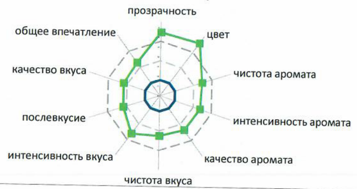
Рис.3.4. Сравнение качества образцов вина тихого (дегустиация 16.09.2021 сет 3)