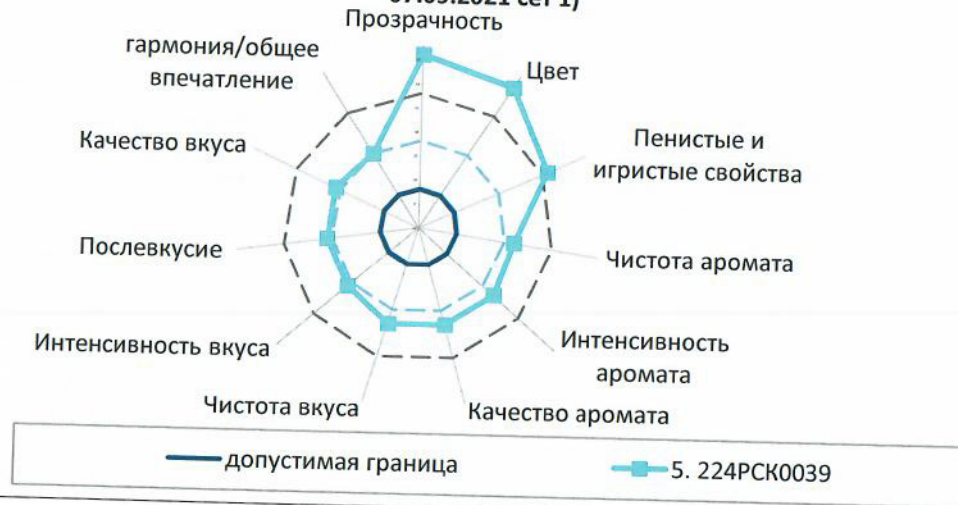
Рис. 1.2. Сравнение качества образцов вина игристого (дегустация 07.09.2021 сет 1)

Протокол не может быть воспроизведен полностью или частично без письменного разрешения Руководителя Сенсорной лаборатории. Полученные результаты относятся к предоставленным Заказчиком образцам. Конец выписки из протокола