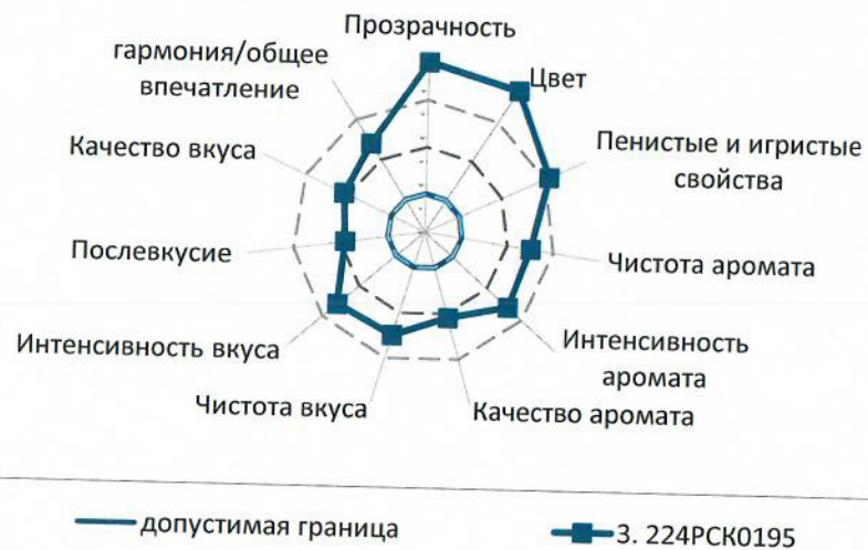
Рис.1.1. Сравнение качества образцов вина игристого (дегустиация 13.09.2021 сет 2)

Протокол не может быть воспроизведен полностью или частично без письменного разрешения Руководителя Сенсорной лаборатории. Полученные результаты относятся к предоставленным Заказчиком образцам. Конец выписки из протокола.