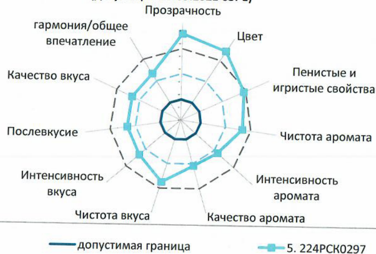
Рис. 1.2. Сравнение качества образцов вина игристого (дегустация 15.09.2021 сет 1)

Протокол не может быть воспроизведен полностью или частично без письменного разрешения Руководителя Сенсорной лаборатории. Полученные результаты относятся к предоставленным Заказчиком образцам. Конец выписки из протокола.