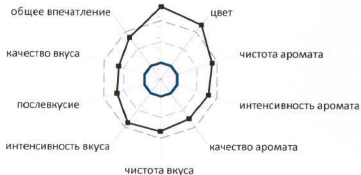
Рис.3.3. Сравнение качества образцов вина тихого (дегустация 16.09.2020 сет 3) прозрачность